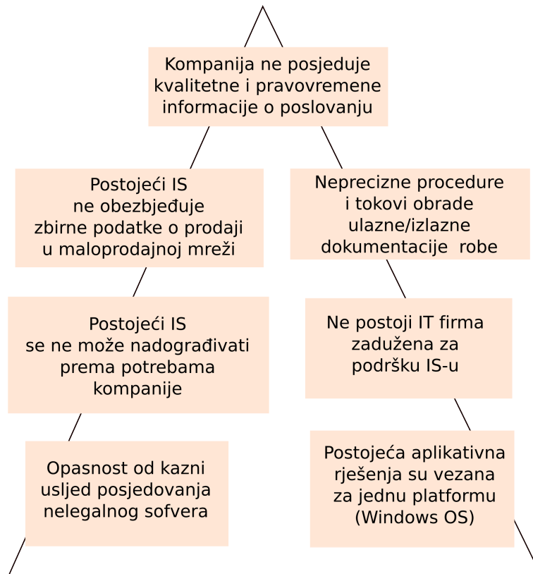
Slika 2.1: Piramida problema

Glavni razlog zbog kojeg se klijent obratio bila je potreba da uvede legalni softver. Analiza postojećeg stana urađena je uz pomoć modela piramide problema (Prašo, 2005). Model piramide problema omogućava hijerarhijski prikaz problema od općih ka konkretnim: